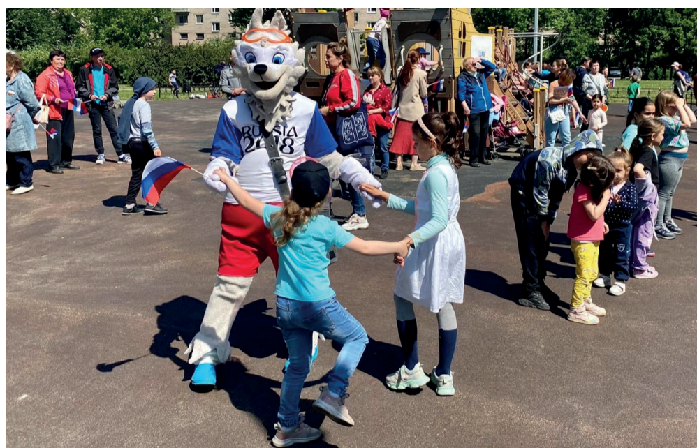
Волк Забивака всегда с нами!

Провели 8 познавательных экскурсий для жителей округа, поздравили юбиляров, состоящих в ветеранских общественных организациях округа от 75 лет и более в количестве 170 человек, поздравили 20 семейных пар от 50 лет и более совместной жизни, закупили билеты ко Дню Победы, ко Дню пожилого человека, закупили подарочные наборы первоклассникам к 1 сентября, на новогодние представления для детей и жителей округа (цирк на Фонтанке «Новогодний Балаган», детская музыкальная сказка «Летучий корабль» в ДК Железно-