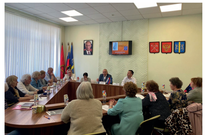
Проект бюджета выносится на публичные слушания