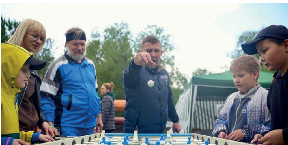
Настольный футбол – чем не спорт? Попробуйте сами!