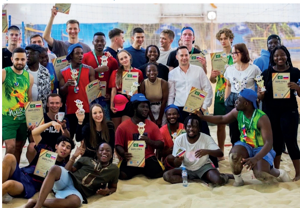
Соревнования по пляжному волейболу в рамках саммита Россия-Африка прошли в дружной атмосфере.

За этот год мы провели в рамках культурно-досуговой деятельности и спорта 13 мероприятий, из них: личное народное гуляние «Масленица», 2 спортивных мероприятия «Мама, папа, я – спортивная семья», «Веселые старты», 2 торжественно-патриотических мероприятия «Флаг державы – символ славы», «Наш дом – Россия», 2 военно-патриотических мероприятия «Зарница», «Завтра День Победы», 1 мероприятие по сохранению традиций и обрядов «Чествование юбиляров семейной жизни от сердца к сердцу», 5 праздников двора, эко-субботник. На всех мероприятиях присутствовал ска-