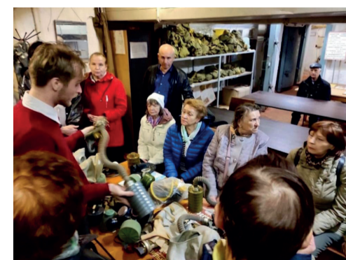
Экскурсия в бомбоубежище даром не прошла. Что делать при ЧС – мы знаем!