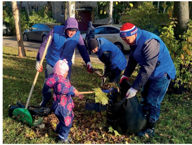
Осенью нужно прибраться. Вышли на субботник, привели в порядок дворы. Мы – молодцы!