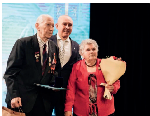
Вместе жизнь прожить – не реку переплыть! Семейные пары, отметившие юбилей, поздравляем вас!

Нерешенных вопросов еще немало, но не все можно решить сразу.