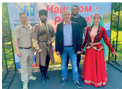
«Наш дом – Россия» – под таким названием мы отметили День России. Отметили чудесно – с песнями и танцами.

дорожников, ледовое шоу в Юбилейном «История любви Шахерезады»).