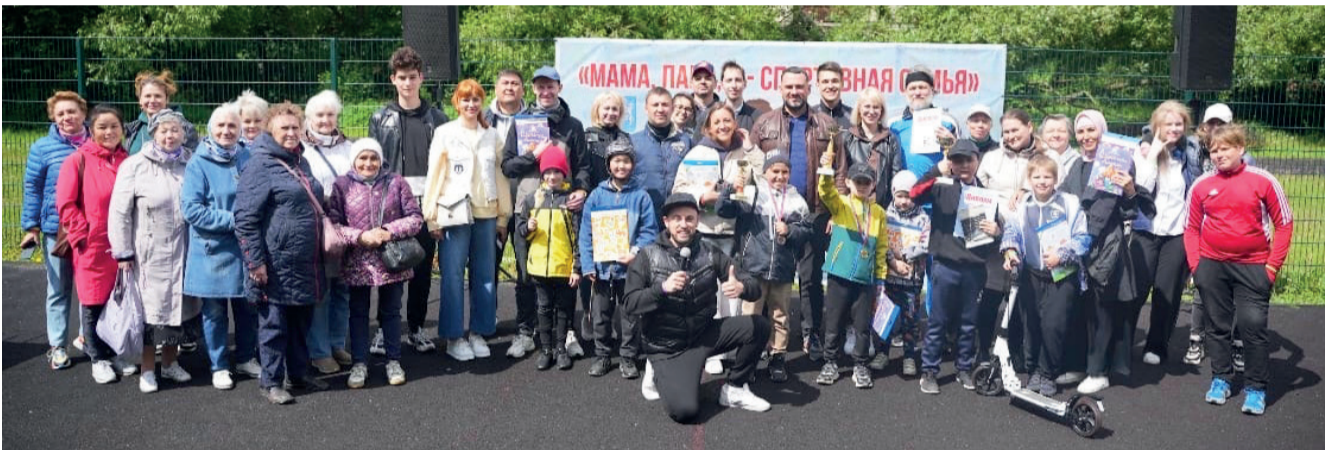
Вот, сколько нас – активных и спортивных семей! Коллективное фото на празднике «Мама, папа, я – спортивная семья!». В следующем году нас будет еще больше. Посоревнуемся!