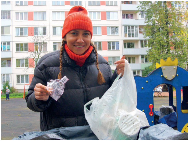
Разбирать мусор по типу – дело непростое, но мы справились! Акцию ЭКО-разбор можем повторить!