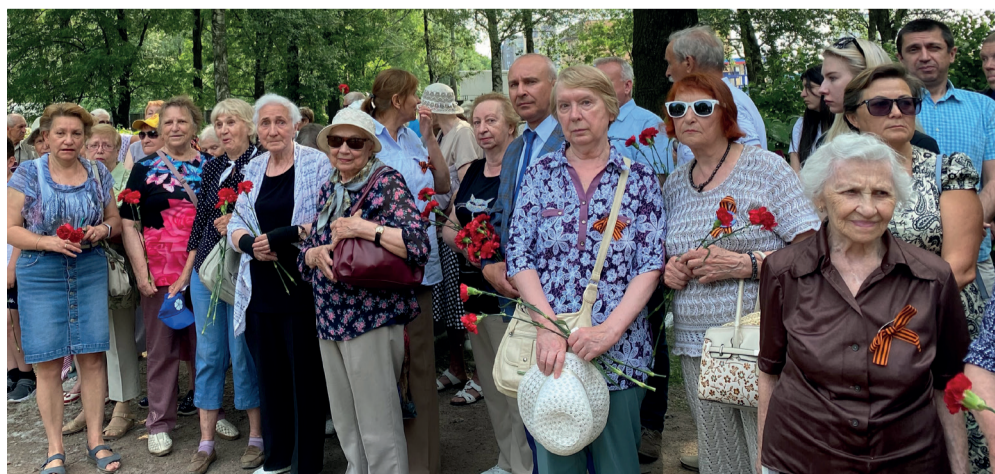
Помним подвиги наших героев, чтим ветеранов, говорим им: «СПАСИБО!» Ни одна памятная дата не останется без внимания. Фото с церемонии возложения цветов героям-воинам.