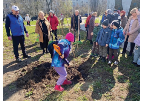
Весенний месячник по благоустройству