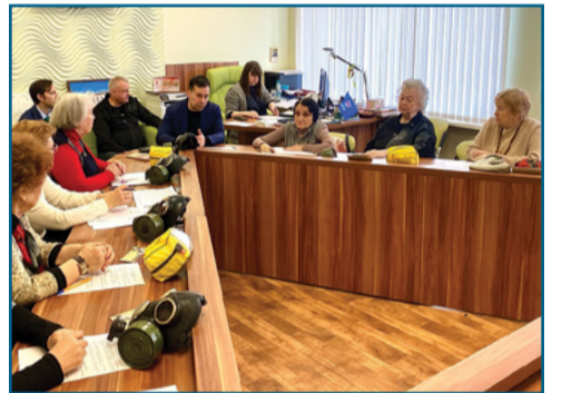
Жизнь муниципального округа